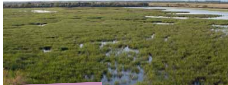
Marais du Vigueirat